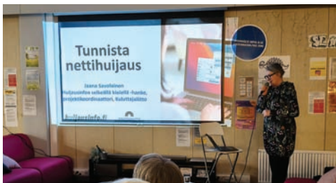
Tietoisku Nettihuijauksista, kerho 19.3.

Seuraa ilmoituksia Kangasalan Sanomissa ja Sydän-Hämeessä sekä yhdistyksen Facebook sivuilla