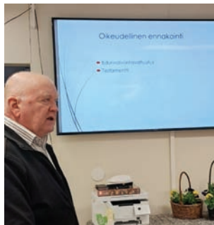
Samuli ja edunvalvontavaltuus

Tiedotamme tapahtumistamme ilmoitustauluilla, Oriveden Sanomien MeNyt palstalla, jäsenkirjeessä, sähköpostilla, yhdistyksemme Facebook sivulla (Eläkeliiiton Längelmäen yhdistys ry), Facebook Länkipohja Nyt, kotisivut https://elakeliitto.fi/yhdistykset/langelmaki sekä tarpeen tullen tekstiviestillä.