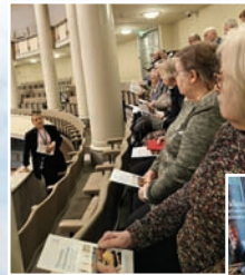
Retkellä Eduskunnan lehterillä 26.2.26

Lisätietoja kotisivuilta: ikaalinen.elakeliitto.fi