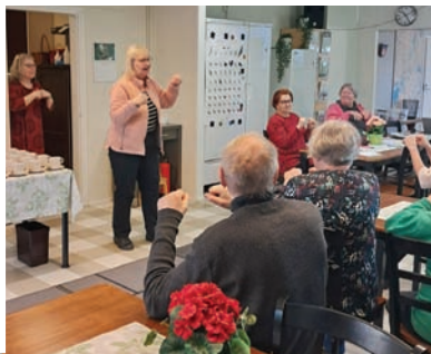
Tuula ja lintubongauksen salat