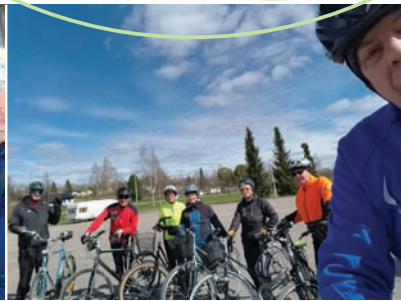
Pyöräilyt alkoivat toukokuun alussa