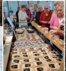
Ikäleidit maistelivat ostosmatkalla juustoja