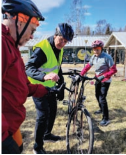
Seniorit Satulaan pyörähuolto

Alkuvuosi on hurautanut vauhdilla. On vietetty hauskoja hetkiä porukalla eri tapahtumissa, tavattu uusia ystäviä ja aloitettu uusia harrastuksia. Seniorit Satulaan aloitti jo kolmannen kauden ja suosio on pysynyt ennallaan. On hauskaa katsoa, kuinka parisenkymmentä pyöräilijää, iältään 65-75 vuotta, herättää iloisia ilmeitä ja ehkä vähän hämmästyttäkin,