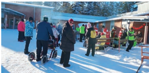
Ystävänpäivätapahtuma Palvelutalo Honkalan pihalla pe 13.02.2026